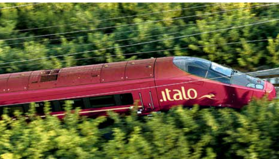
Le train électrique à grande vitesse Italo.

En service depuis décembre 2023, Galloway 2 a une puissance de 147 mégawatts, s'étend sur une surface d'environ 3,7 km 2 (soit environ 520 terrains de football) et produit suffisamment d'énergie propre pour alimenter en électricité 60 000 personnes dans la région.