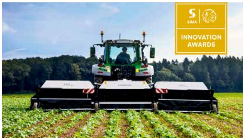
Ecorobotix a reçu plusieurs prix pour sa technologie.

les champs. Ils sont équipés d'une technologie de détection de pointe et de fonctions de caméra pour reconnaître les plantes et distinguer les plantes utiles des mauvaises herbes nuisibles. Un logiciel développé par Ecorobotix et basé sur des algorithmes d'intelligence artificielle traite et interprète les données collectées. La pulvérisation elle-même est réalisée par des buses spéciales qui, commandées par le logiciel du robot, envoient des jets de haute