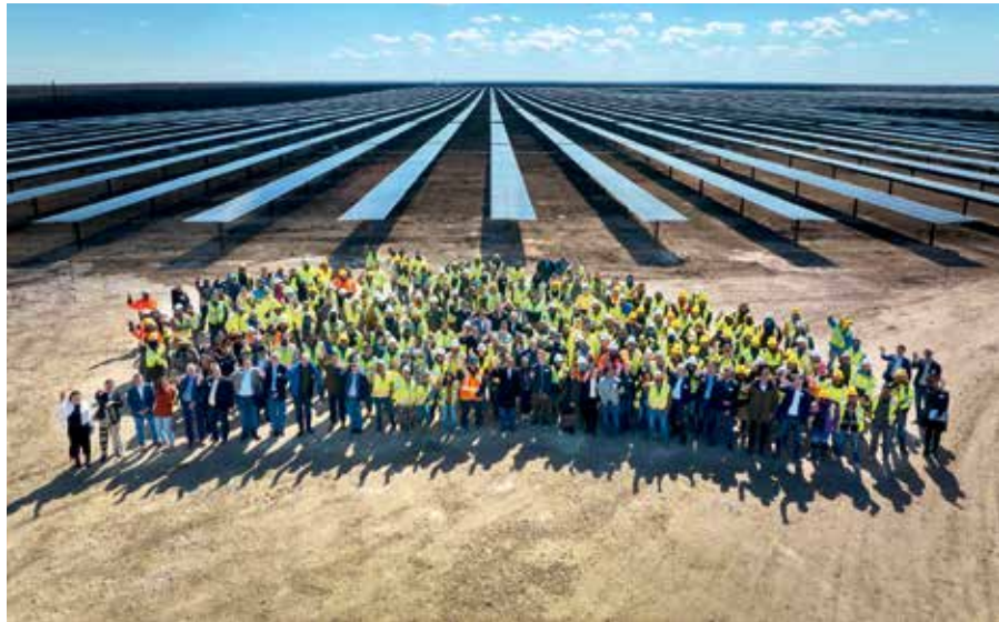
Un projet solaire couronné de succès : Galloway 2 au Texas (États-Unis).

Ecorobotix développe, produit et commercialise de la robotique utilisée dans l'agriculture. Chaque année, plus de 3,5 millions de tonnes de produits phytosanitaires sont utilisés dans l'agriculture au niveau mondial. À cela s'ajoutent plusieurs millions de tonnes d'engrais. Les produits phytosanitaires protègent les cultures contre les